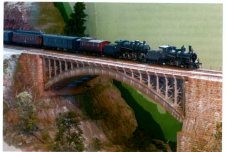
Talwärts fahrender Personenzug auf der Rohrbachbrücke von Erich Schmied.