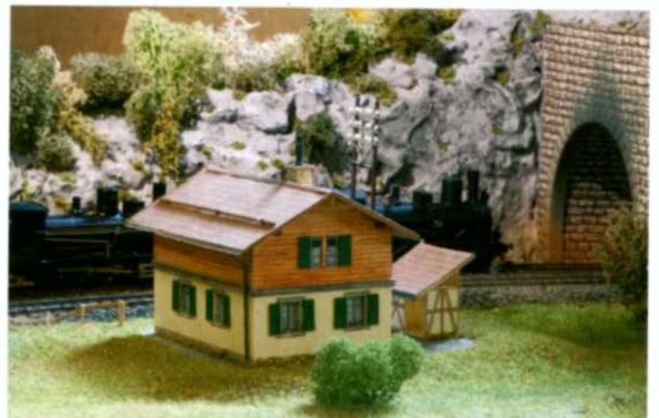
Kartonbausatz eines normierten Gebäudes der ehemaligen Gotthardbahn (EA-Shop).