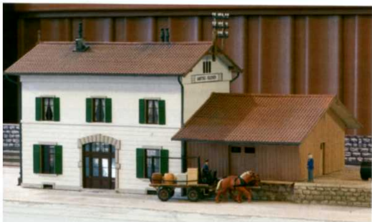
Stationsgebäude Amsteg-Silenen aus der Produktion von GBmodell (Bausatz).