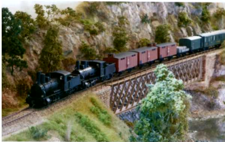
Bergwärts fahrender Güterzug auf der Gumpischbachbrücke